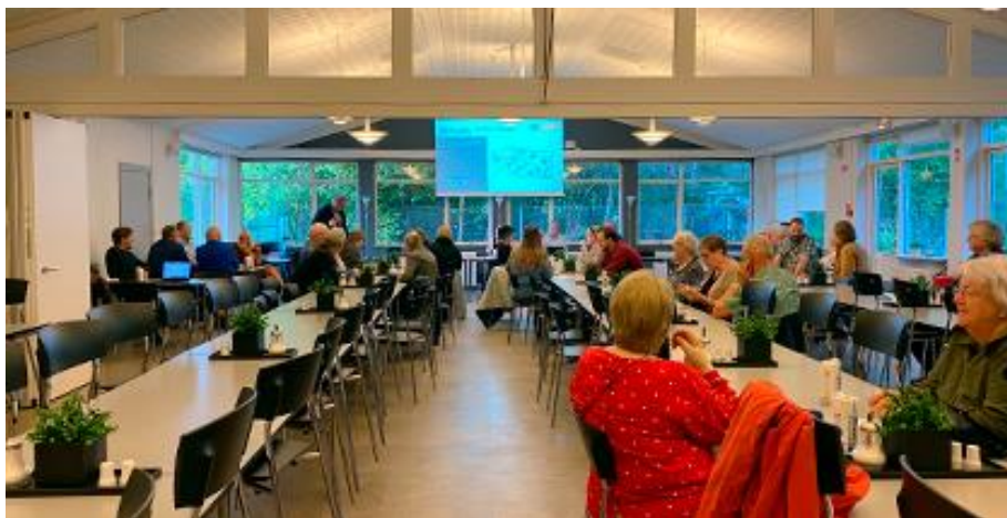
Informationsmøderne fandt sted i Danhostels lokaler.